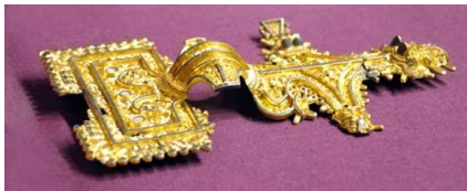
Dalempenna eldre jernalder: utstilt i Steinkjer for første gang på 146 år i 7 timer - 2014. Funnet i Sparbu 1868. Kulturhistorisk museum UIO